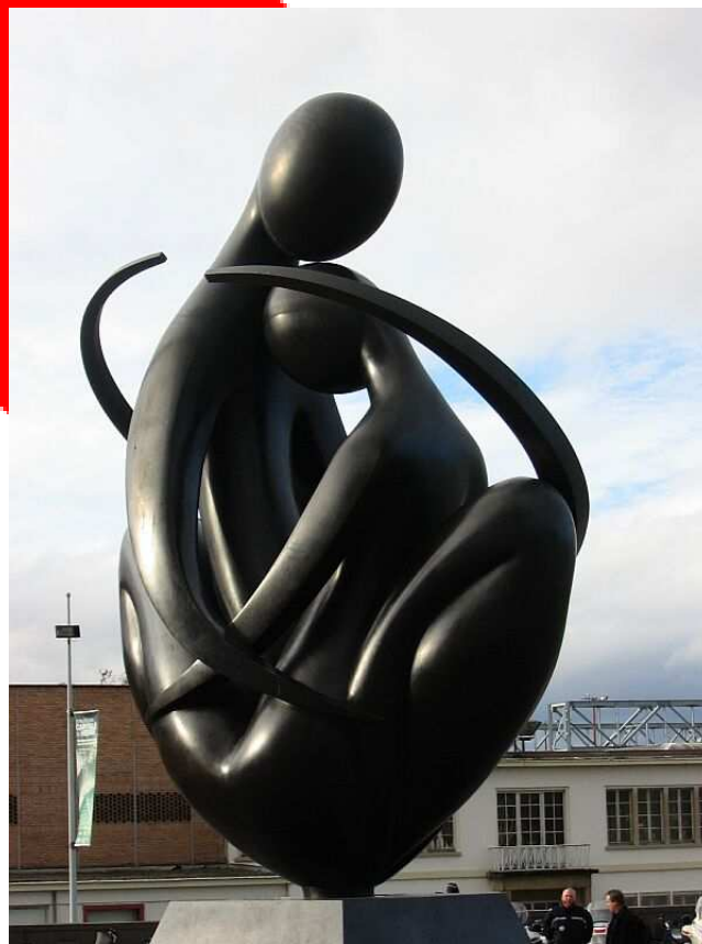
Socha před budovou Evropského parlamentu.