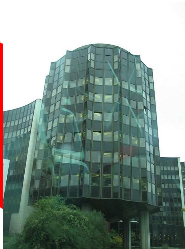
Budova Evropského soudu pro lidská práva.