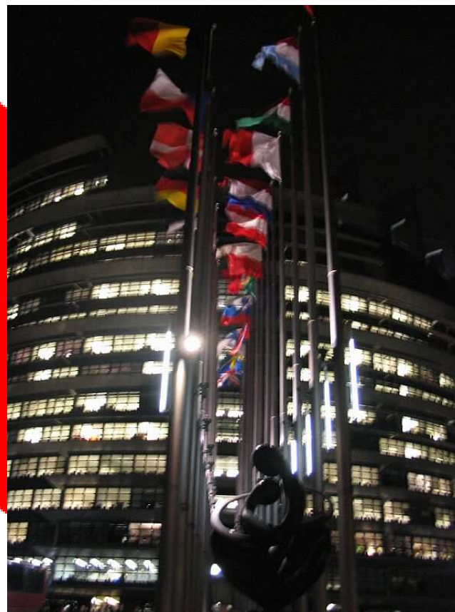
Budova Evropského parlamentu.