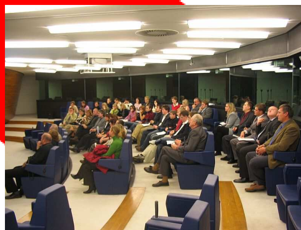
Nádvoří a interiér budovy Evropského parlamentu.