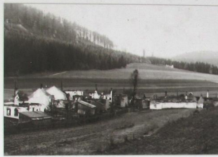
Pohled na vypálenou obec. The view of burned village Javoříčko nach dem Brand.