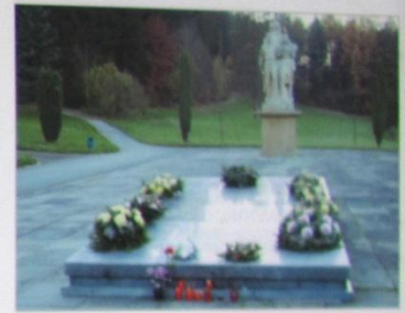
Společný hrob obětí – památník. The mass grave of victims with memorial (today on the right and on the left).