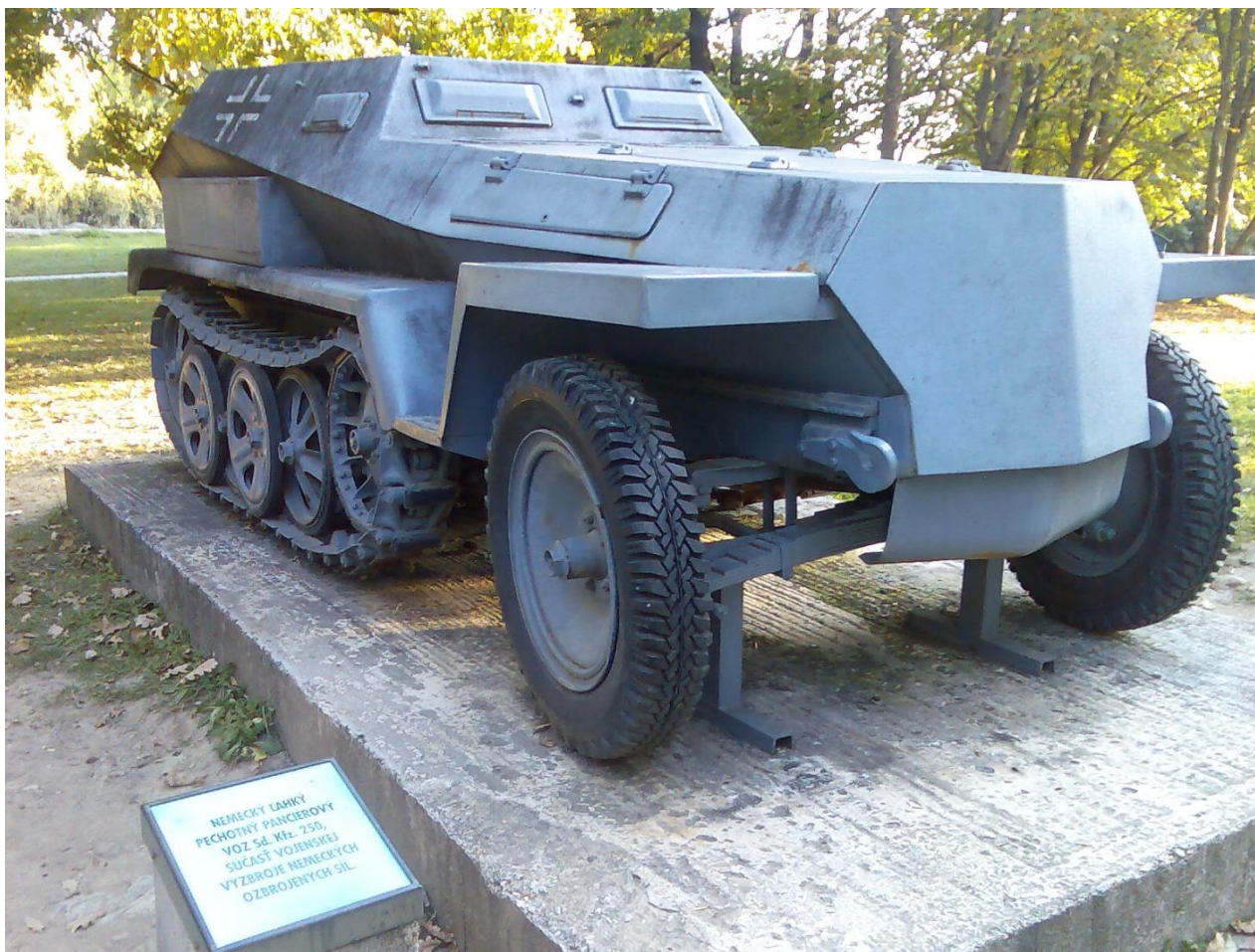
NEMECKÝ LÁHKY PECHOTNÝ PANCEROVÝ VOZ Sd. Kfz. 250, SÚČASŤ VOJENSKEJ VÝZBROJE NEMECKÝCH OZBROJENÝCH SÍL