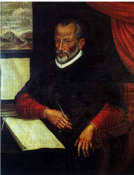
Giovanni Pierluigi da Palestrina

Vrcholu vokální polyfonie dosáhli v 16. století renezanční mistři: